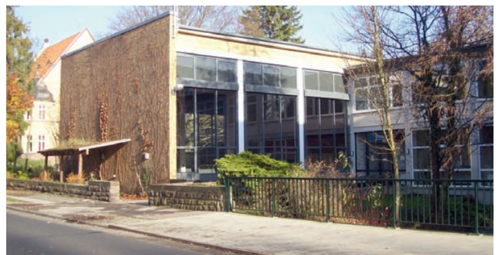
Das neue Domizil der Volkshochschule: Alles unter einem Dach.

Die neue Mensa wurde bereits eingeweiht. Hierfür wurden 770.000 € angewandt.