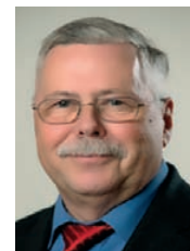
Wolfgang Wiek Verwaltungs- ausschuss Bauausschuss Finanzausschuss