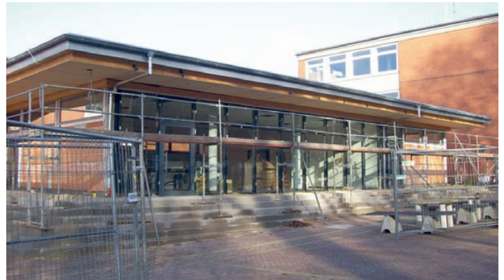
Das Alfelder Gymnasium ist für die Ganztagsbetrieb gerüstet.

Für die Einrichtung des Ganztagsbetriebes baut der Landkreis einen Multifunktionsbereich aus Mitteln des Konjunkturprogramms an das Gymnasium an. Der Anbau erhält drei Nutzungsbereiche: einen Mehrzweckraum, einen Arbeitsbereich für die Hausaufgabenbearbeitung und Kleingruppen sowie die Schulbibliothek. Die Baukosten betragen rund 690.000 €.