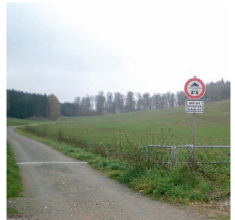
Föhrste, Heidegrunder Straße

Erfreulich ist, dass sämtliche in den vergangenen 25 Jahren seitens des Ortsrates vorgetragenen Lösungsmöglichkeiten mit in das Konzept eingeflossen sind. Durch die gute Vorarbeit von Föhrster Ortsbürgermeistern und SPD Ratsfraktion, ist es gelungen, dieses wichtige Konzept umzusetzen.